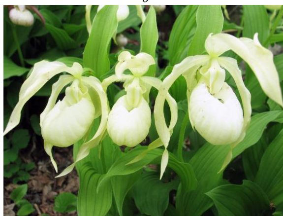
Рис. 27. Особи C. × ventricosum , Sw. исключительно редких окраса (а) и формы (б).