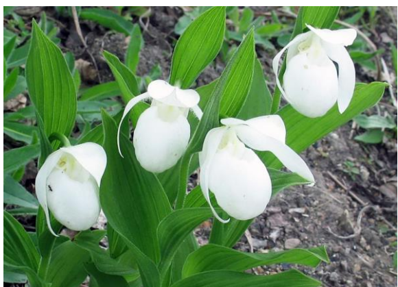
Рис. 25. Белоцветковая форма башмачка крупноцветкового Cypripedium macranthum Sw.