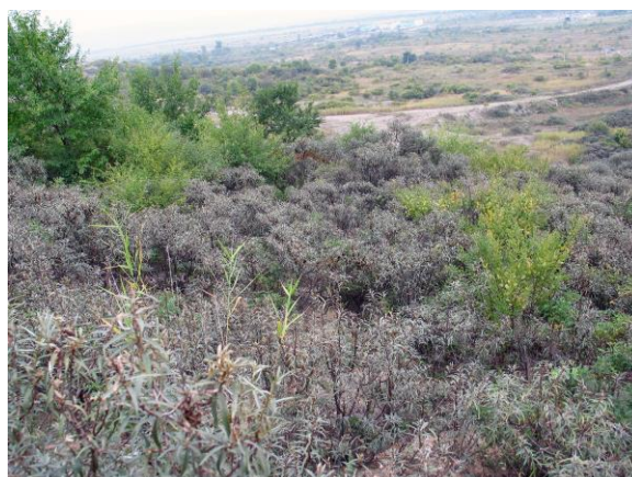
Рис. 29. Облепиха крушиновидная Hippophae rhamnoides L. расселилась по всей поверхности склона, но лучшим развитием ее заросли характеризуются в ложбинах стока (Окрестности Уссурийска, Приморский край).

Грунт со склона и долины использовался на отсыпку стройплощадок. На склоне были полностью уничтожены и растительный покров, и почвы. Поверхность склона подверглась неодинаковому разрушению, поэтому и процессы восстановления растительного покрова протекали (и протекают) неодинаково. На участках с крутым уклоном облепиха продолжает расти отдельными особями и группировками. В период созревания ее ягод в Приморье наступает сезон тайфунов, и семена с таких мест вместе с сыпучим субстратом смываются проливными дождями к подножию. На остальной территории склона облепиха образует очень густые заросли в местах со сколько-нибудь вогнутой поверхностью и у подножия (рис. 29).