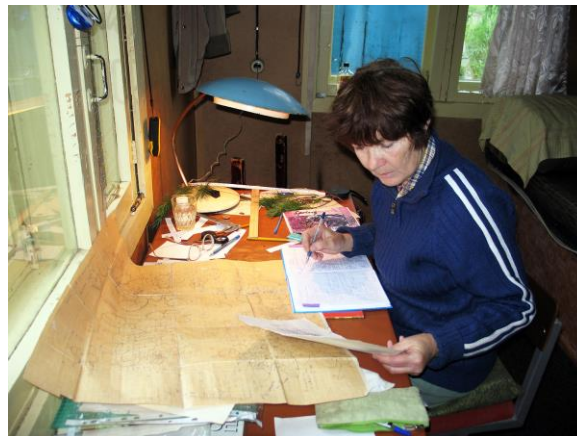
Рис. 23. На стационаре «Снежная Долина». Подготовка к следующему рабочему дню (Магаданская область, 2006 г.).

Без их помощи было бы невозможно выполнить требуемый объем работ. Результаты ревизии подтвердили ранее сделанный вывод о высокой информативности характеристик ценоотической структуры и целесообразности их использования для целей наземного мониторинга (рис. 23).