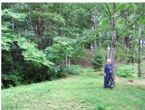
Рис. 39. Калопанакс, или диморфант семиллопастной Kalopanax septemlobus (Thunb.) Koidz. не оставляет равнодушными посетителей дендрария Горнотаежной станции ДВО РАН. Слева цветет аралия высокая Aralia elata (Miq.) Seem., или аралия маньчжурская Aralia mandshurica Rupr. Et Maxim.