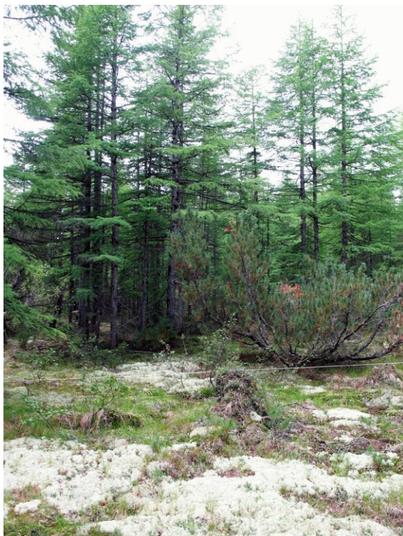
Рис. 9. Производный лиственничник Larix cajanderi Мауг кустарничково-лишайниковый с подлеском из кедрового стланика Pinus pumila (Pall.) Regel в пойме р. Дукча – один из основных объектов наших исследований (Магаданская область).

В новую лабораторию я пришла с четким намерением заняться изучением фитоценотической структуры вторичных лесов, подобрав для этой цели типологические аналоги климаксовых лиственничников, изученных ранее на стационаре «Нараули». Большое значение имела легкодоступность объектов исследований. Так, если для поиска коренных лесов надо было выезжать в удаленные районы, где еще сохранились остатки нетронутых лиственничников, то с подбором производных лесов проблем не было: все леса вокруг Магадана и населенных пунктов Магаданской области производные, восстановившиеся на месте вырубленных в 40–50-е гг. (рис. 9).