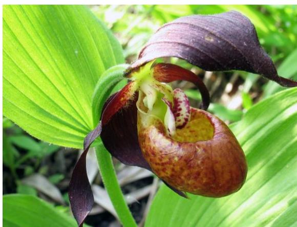
Рис. 24. Редко встречающиеся формы башмачка настоящего Cypripedium calceolus L.