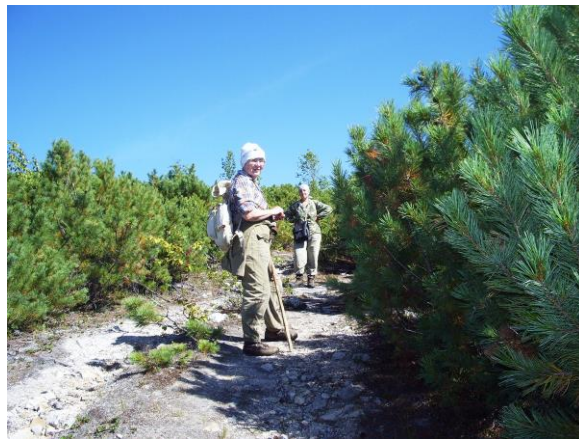
Рис. 11. Долгий путь на вершину макросклона к пробным площадям в каменноберезняках. Дорога между кедровостланиковыми зарослями Pinus pumila (Pall.) Regel выполняет функцию противопожарной полосы.

Из Магадана можно было добраться до поселка на автобусе, а на все наши объекты, самый дальний из которых находился в 4 км от поселка, – пешком. Надо признаться, что путь к ним не всегда был легким (рис. 11, 12).