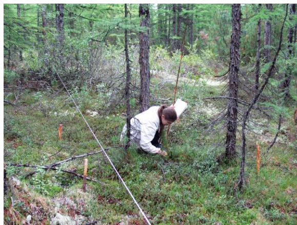
Рис. 10. Учет возобновления (всходов и самосева) лиственницы Каяндера Larix cajanderi Мауг в лиственничнике лишайниково-кустарничковом в 2006 г. В 1986 г. в его напочвенном покрове преобладали лишайники, в течение 20 лет их сменили вересковые кустарнички (Магаданская область).

ли обеспечить длительность наблюдений (мониторинг) за восстановительным процессом в разных типах леса без больших затрат на транспорт и быт в дальних поездках (рис. 10).