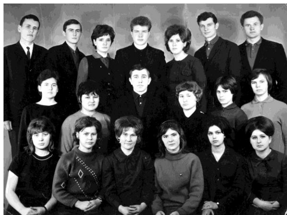
Рис. 4. Наша студенческая группа лесохозяйственного факультета ПСХИ. Второй курс. Я третья справа в нижнем ряду (Уссурийск, Приморский край, 1968 г.).

ются визиры и добывается живица и др. Я почти все время получала повышенную стипендию, а с третьего курса – именную стипендию В. Л. Комарова, основателя науки на Дальнем Востоке. Но жили мы не только учебой. Молодость сама по себе прекрасна, а еще тем хороша, что везде и все хочется попробовать и успеть – общественная работа, спорт, художественная самодеятельность, учеба на права по вождению, посадка лиственных и хвойных деревьев в учебно-опытном лесхозе. А какими замечательными были учебные практики! Сколько всего разного произошло за годы учебы! (рис. 4).