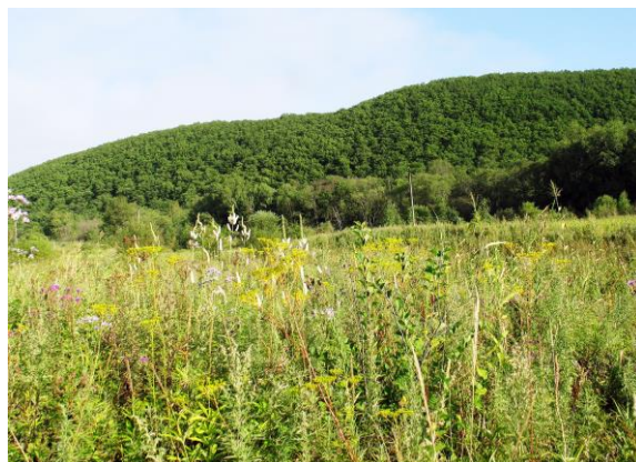
Рис. 1. В Южном Приморье инсолируемые горные склоны заняты производными дубняками, а долины – луговой растительностью.

В Ханхезе мы прожили около трех лет и перебрались ближе к г. Уссурийску – в с. Борисовка, а затем в с. Ново-Никольск. Оба села расположены в Раздольнинской долине. К сожалению, коренные леса на территории долины и прилегающих горных склонах были уничтожены в начальный период освоения Приморья. На протяжении многих десятилетий лесную растительность в этой местности, как и повсеместно, представляют малоценные порослевые дубняки на склонах гор, разрозненные куртины лиственных лесов в долинах рек, ивняки вдоль притоков и проток (рис. 1).