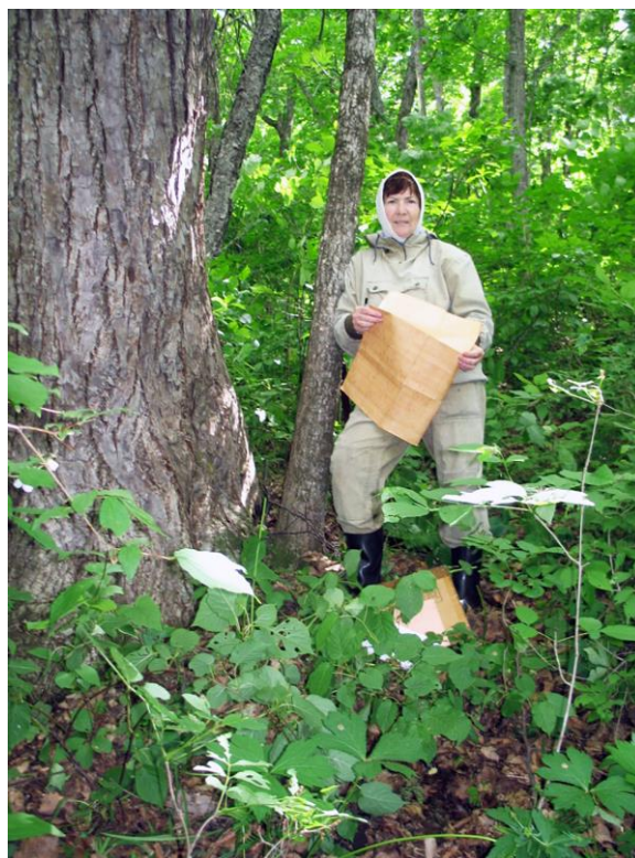
Рис. 44. Ревизия постоянной пробной площади в дубово-липовом лесу на северном склоне. Экологический профиль «Горнотаежный» (Приморский край, 2017 г.).

На станции сменилось руководство и вновь оказались востребованными фитоценологические исследования, как основа наземного мониторинга лесов и комплексного изучения взаимосвязей между компонентами биогеоценоза. В настоящее время продолжаю заниматься любимым делом – изучением ценогической структуры лесов Дальнего Востока (рис. 44).