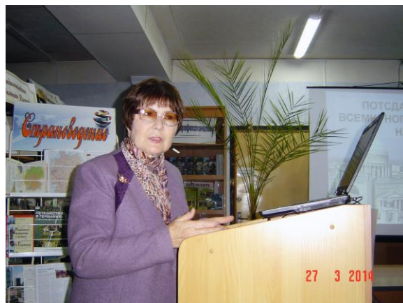
Рис. 41. Лекция студентам географического факультета школы педагогики ДВФУ о Потсдаме и об облепихе крушиновидной, ее натурализации под Уссурийском (Уссурийск, 2014 г.).

Читая лекции, проводя практические занятия, вспоминала годы собственной учебы и то, как преподаватели лесфака старались вложить в наши головы самую нужную, по их мнению, информацию, с какой любовью передавали свои знания и как переживали за нас на экзаменах и защитах дипломных проектов. Теперь через все это проходила сама (рис. 41).