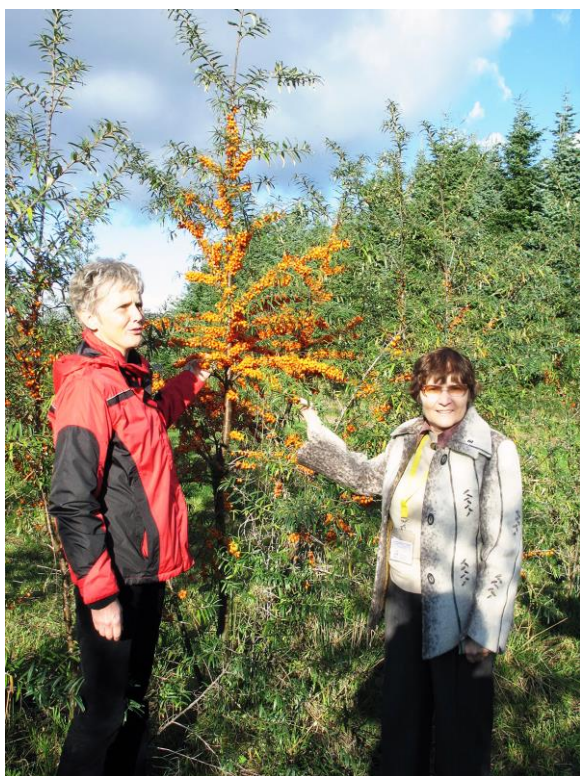
Рис. 34. На облепиховой плантации с производственным мастером в питомнике г. Гюстров, Германия.

В последние десятилетия облепиха появилась и в других сильно нарушенных местах, где растет обычно небольшими куртинами, вблизи дачных поселков, но пример расселения ее под Уссурийском самый впечатляющий.