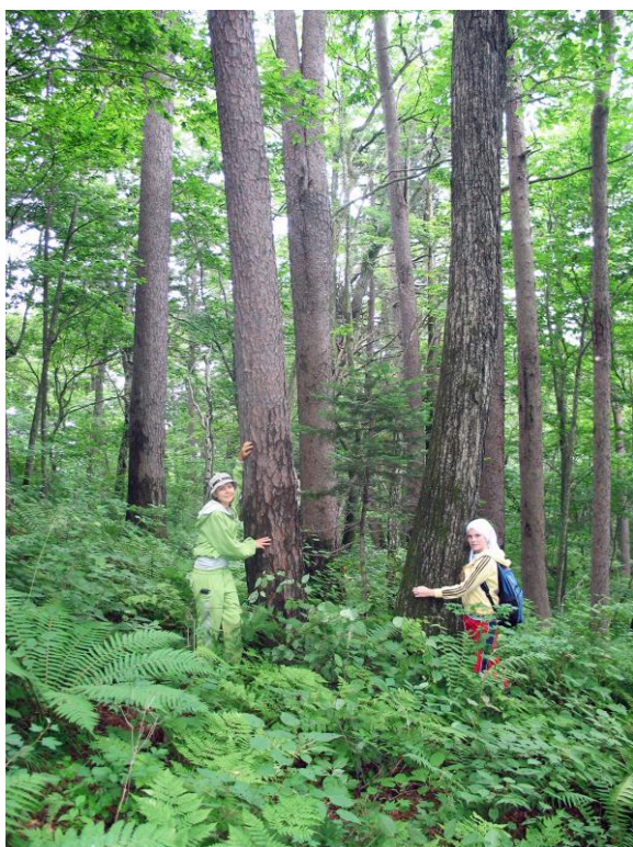
Рис. 2. Коренной чернопихтово-широколиственный лес в Артемовском лесничестве, в предгорьях южного Сихотэ-Алиня, Приморский край.