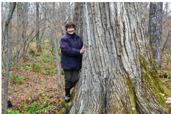
Рис. 38. Возле ильма-великана Ulmus propinqua Koidz. (Уссурийский заповедник, Приморский край, 2017 г.)