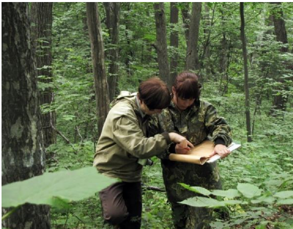
Рис. 18. Обучение студентки-дипломницы описанию и картированию горизонтальной структуры травяного яруса на постоянной пробной площади (2010 г.).