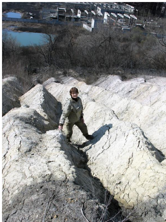
Рис. 30. Вся нарушенная поверхность соседнего склона испещрена глубокими эрозионными канавами. Птицы в полете огибали эту территорию и не обеспечили ее семенами облепихи (Окрестности Уссурийска).

Благодаря корнеотпрысковой деятельности ярко проявилась противозерозионная роль облепихи. Там, где она не смогла заселиться, образовались глубокие промоины-канавы, почти овраги (рис. 30).