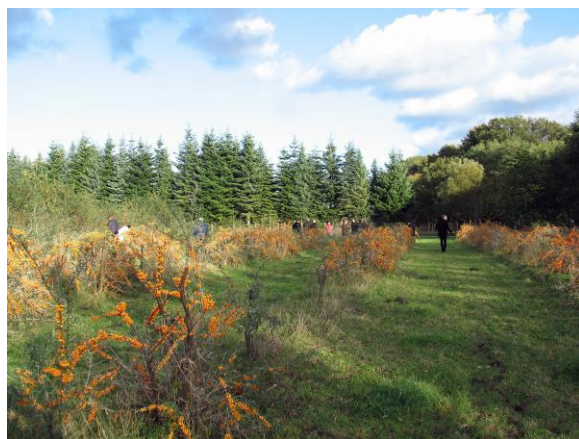
Рис. 32. Плантация облепихи в г. Гюстров (Германия), подготовленная к сбору урожая.

Впечатляли плантации облепихи размером до 13 га и предприятия по ее переработке в Германии (рис. 32–34).