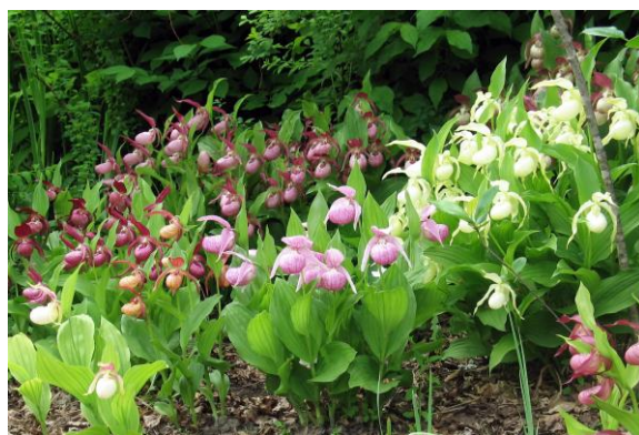
Рис. 26. Фрагмент коллекции башмачков ( Cypripedium L.)