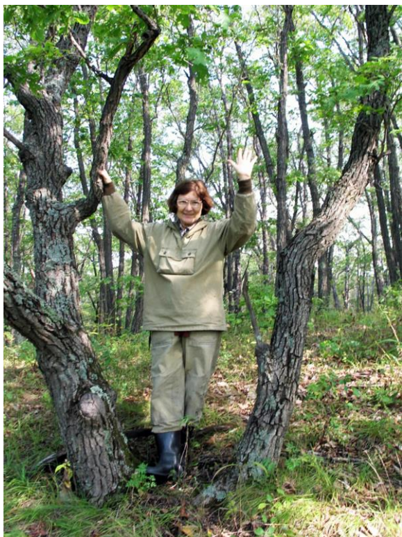
Рис. 16. С переходом к водоразделу прямоствольные деревья сменяются криво- и многоствольными. Дубняк осоковый (Приморский край).

За пробные площади на северном склоне было боязно браться – слишком сложными и непонятными казались здешние леса. Одни и те же виды растений росли по всему склону, но было очевидно, что там не один тип леса. Лесообразительные материалы по лесам Горнотаежной станции отсутствовали. Много раз пришлось вдоль и поперек пройти по макросклону, пробираясь через густой подлесок и поваленные деревья, чтобы выбрать наиболее характерные участки и сориентироваться, где кончается один тип леса и начинается другой.