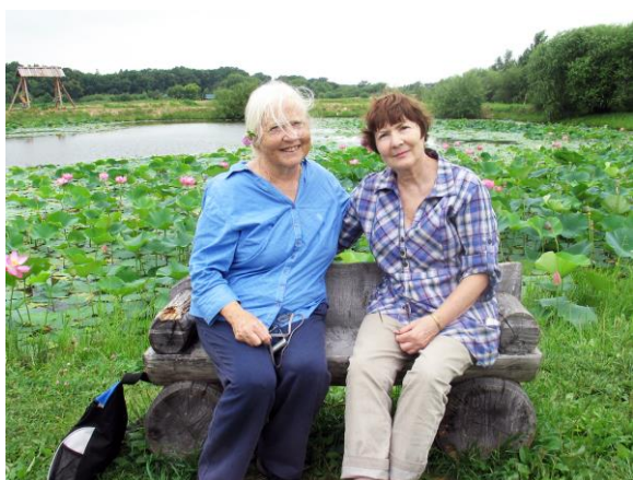
Рис. 40. На искусственном озере лотосов в семейно-историческом парке «Изумрудная долина» (Уссурийск, Приморский край, 2017 г.).

Лекции были подготовлены в форме презентаций. В качестве примеров в них приведены сведения о лесах Дальнего Востока, результаты научных исследований дальневосточных ученых. Электронные варианты курсов размещены на сайтах Ботанического сада-института ДВО РАН и библиотеки школы педагогики ДВФУ. Время от времени