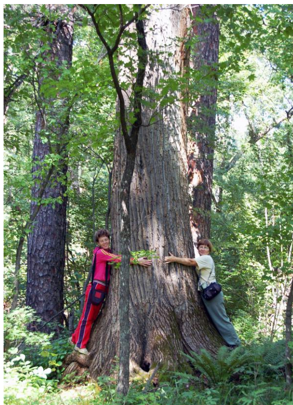
Рис. 37. Ильм долинный (сродный) Ulmus propinqua Koids. в пойме р. Комаровка, Уссурийский заповедник, Приморский край (2009 г.).