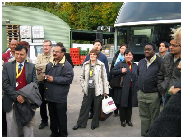
Рис. 31. Среди участников конференции ISA-2013 в Германии.

В 2013 г. мне было предложено выступить с докладом о натурализации облепихи в Приморском крае на 10 конференции в Германии в г. Потсдаме (рис. 31).