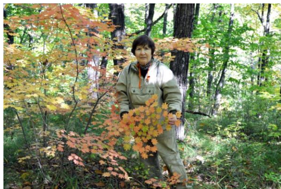
Рис. 17. В дубняке с кленом ложнозибольдовым Acer pseudosieboldianum (Pax.) Kom. (Приморский край, 2017 г.).

Постепенно накапливались данные по югу Приморского края, одновременно продолжались обработка и анализ магаданских материалов. В 1996 г. в издательстве «Дальнаука» опубликована вторая моя монография «Фитоценотическая структура вторичных лесов на юге Магаданской области», а в 1997 г. в издательстве «Алфавит» –