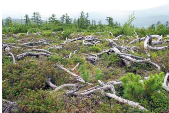
Рис. 6. Старая гарь с несгоревшими остатками кедрового стланика. Седловина на Хасынском макросклоне (Охотское побережье Магаданской области).

В процессе проработки темы предстояло выяснить закономерные последствия лесных пожаров в разных климатических зонах области с учетом типологических характеристик насаждений. Зимой были выбраны лесхозы, на территории которых предполагалось проводить исследования: Тауйский – на самом юге Магаданской области (долины рек Тауя и Яны) и северная часть Палаткинского лесхоза – в центральной части области (верховья Колымы). В обоих лесхозах было много гарей разных сроков давности (рис. 6).