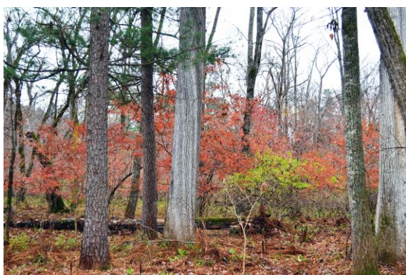
Рис. 3. Коренной кедрово-широколиственный лес в Уссурийском заповеднике, Приморский край.

Как-то в рейсовом автобусе от девушки, окончившей нашу школу и поступившей в Приморский сельскохозяйственный институт, я узнала, что в нем есть лесохозяйственный факультет. Какая неожиданность! Оказывается, есть институт, в котором изучают лес! Вопрос был решен – я поступаю на лесфак!