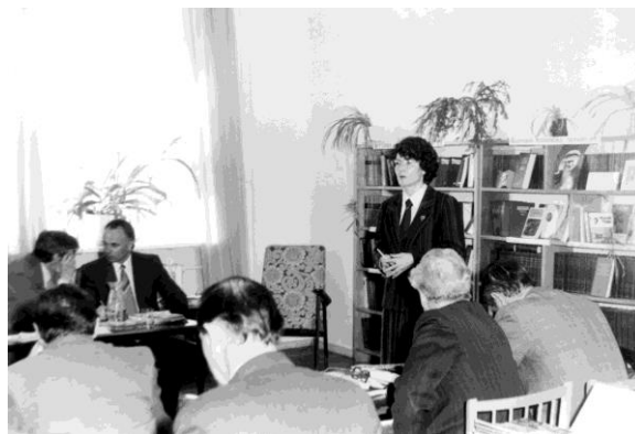
Рис. 13. Выступление на втором Всесоюзном совещании по проблемам притундровых лесов (Магадан, 1987 г.).

Время шло. В конце 80-х гг. в Магаданской области особенно острой стала проблема лесозаготовок, поскольку к этому времени запасы доступной древесины были полностью истощены. Лесопромышленники пытались получить разрешение на заготовку леса под видом санитарных рубок в запретных полосах вдоль нерестовых рек. Магаданская ЛОС перестала быть лидером в лесоведении притундровой зоны, квалифицированных сотрудников на станции не осталось. Решением этих проблем поневоле стали заниматься геоботаники ИБПС и Магаданское отделение общества охраны природы, отстаивая последние островки высокопродуктивных лиственничников в охранной зоне. В 1987 г. в Магадане было проведено 2-е Всесоюзное совещание по проблемам притундровых лесов (рис. 13).