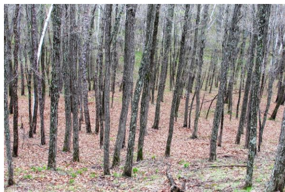
Рис. 15. В нижней части южного склона в густом древостое преобладают прямостоящие деревья дуба монгольского Quercus mongolica Fisch. ex Ledeb. с парашютной формой кроны (Приморский край).

В 1992 г. заложили ППП в сухих дубняках на южном склоне – самых бедных по флористическому составу и простых по ценотической структуре. Были выявлены и описаны экобиоморфы дуба монгольского Quercus mongolica Fisch. ex Ledeb. как один из главных критериев, используемых при выделении парцелл и типов леса. На рис. 15 и 16 показаны различия между двумя из семи выделенных экобиоморф дуба.