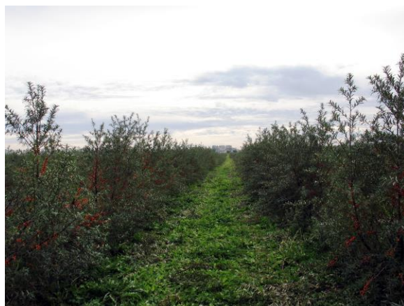
Рис. 33. Плантация облепихи в пос. Квеллендорф, Германия.

Смотрела, сравнивала и пришла к выводу – можно и нужно развивать облепиховое хозяйство в Приморском крае. Это я и предложила на очередном VIII форуме «Природа без границ». В крае есть и подходящие территории для выращивания облепихи, и многочисленные предприятия пищевой промышленности, и свободные рабочие руки.