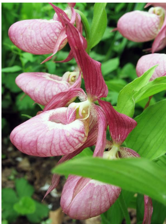
Рис. 28. Гибридные формы C. calceolus L. и C. macranthon Sw. или башмачок вздутый C. × ventricosum Sw.

Весной 2006 г. были начаты мониторинговые исследования в уникальных антропогенных сообществах с доминированием облепихи крушиновидной, обнаруженных за тысячи километров от естественного ареала вида (горы Западного Памира и Тибета, в России – Забайкалье и Алтай) под Уссурийском – в долине р. Раковка и на прилегающем к ней южном склоне одного из западных отрогов хр. Пржевальского. Облепиха заняла весь склон от подножия до водораздела. Расселение ее – спасибо птицам! – связано со строительством градообразующих предприятий Уссурийской ТЭЦ и Уссурийского картонного комбината в 1992–1993 гг. на месте бывших дачных участков.