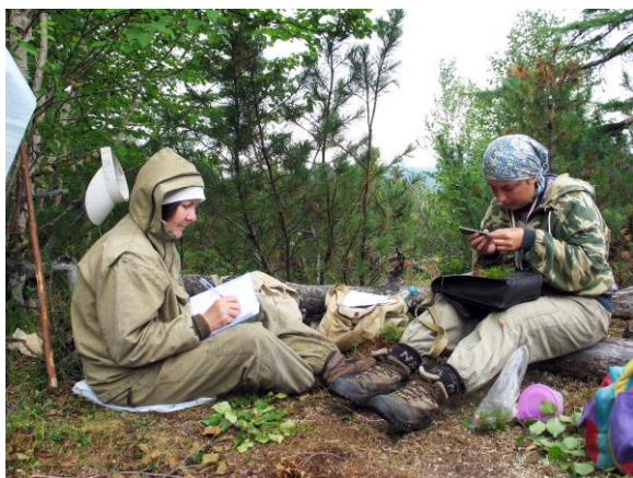
Рис. 22. Подсчет и обмеры числа особей в 2-летнем пучке кедрового стланика.

Без их помощи было бы невозможно выполнить требуемый объем работ. Результаты ревизии подтвердили ранее сделанный вывод о высокой информативности характеристик ценоотической структуры и целесообразности их использования для целей наземного мониторинга (рис. 23).